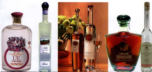
Auswahl hochwertiger Tresterbrände. Verkostungsnotizen und Bezugsquellen unter www.sommelier-magazin.de

und Rosenmuskateller, Lagrein und der Blauburgunder sowie neuere Rebsorten wie Chardonnay, Sauvignon, Cabernet und Merlot, die ebenfalls für die Herstellung von Tresterbränden Verwendung finden.