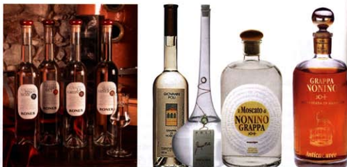
Die ganze Welt der Grappe: Unterschiedliche Erzeuger aus den verschiedensten Regionen Italiens bieten eine gute

ZETTER - Die Weinagentur GmbH & Co. KG Hornbach 15 • 67433 Neustadt 0 63 21-39 56 0 • Fax 0 63 21-39 56 56 www.zetter-wein.de • www.zetter-wein.de