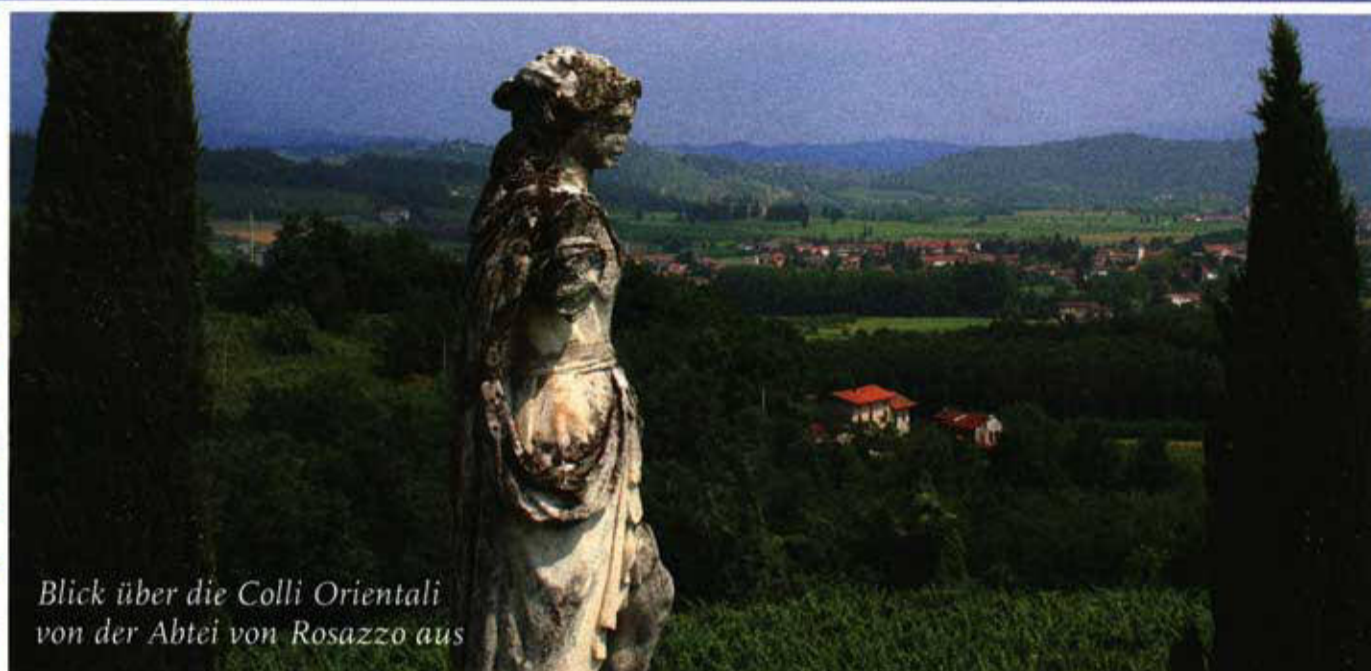
Blick über die Colli Orientali von der Abtei von Rosazzo aus