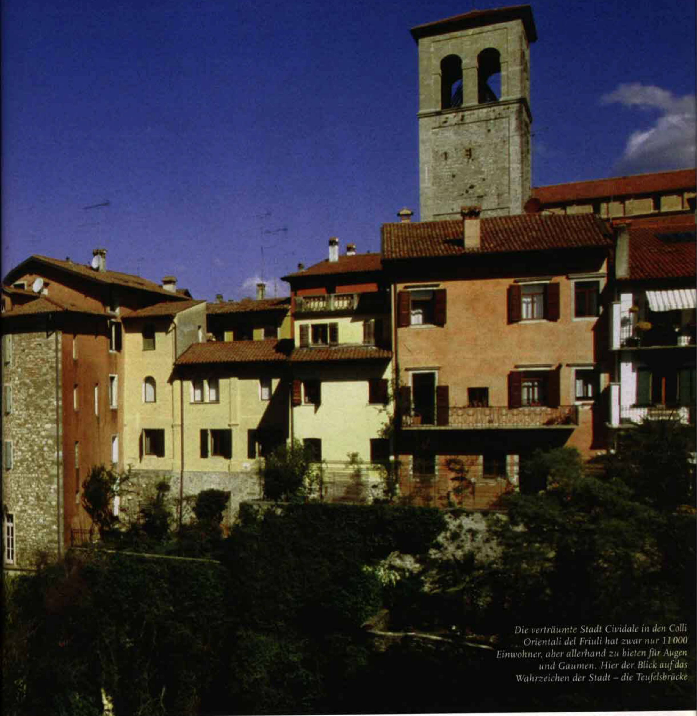
Die verträumte Stadt Cividale in den Colli Orientali del Friuli hat zwar nur 11 000 Einwohner, aber allerhand zu bieten für Augen und Gaumen. Hier der Blick auf das Wahrzeichen der Stadt – die Teufelsbrücke

male deutlich: Mit Wald und den julischen Voralpen im Rücken sind selbst im Hochsommer die Temperaturen noch absolut erträglich. Andererseits sorgt rund um das Jahr ein wärmerer Wind von der Adria für eine gute Durchlüftung der Weinberge. Deutliche Temperaturschwankungen zwischen Tag und Nacht sorgen für frische, klare Aromen und