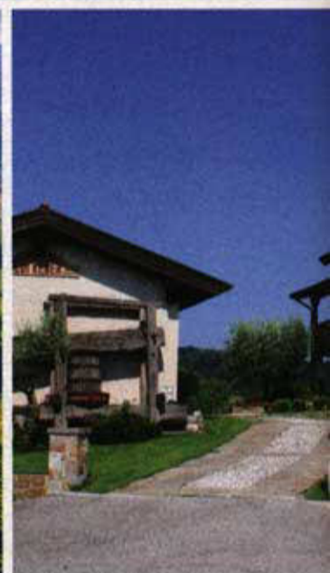
1. Mit dem Motorrad besonders reizvoll: das kurvenreiche Collio